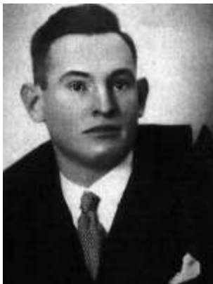
ca 1930 (1)