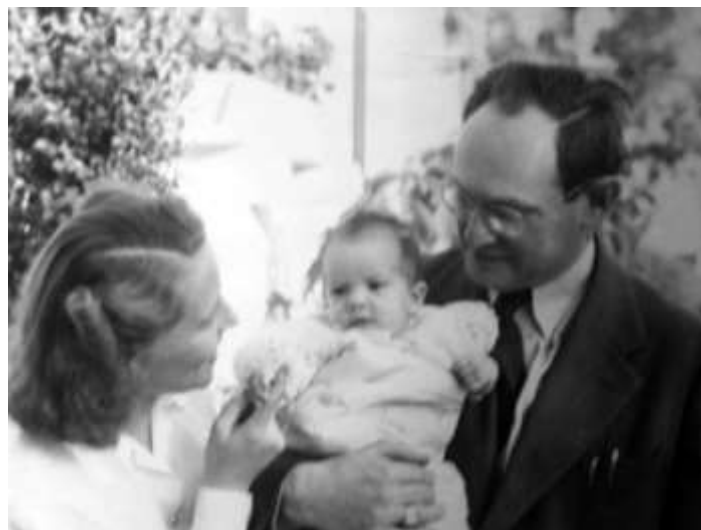
CHL mit Ehefrau und Tochter