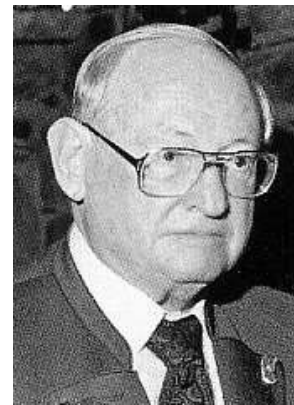
ca 1990 (3)