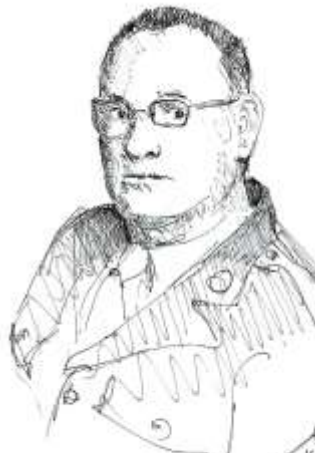
ca 1945 (2)